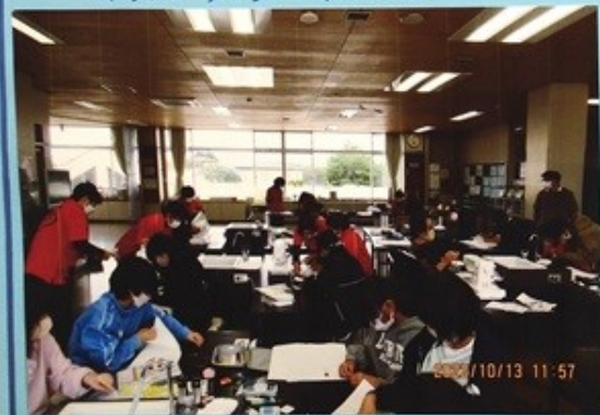
<ミシン支援・テック>