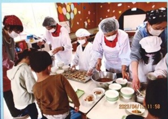
<給食支援・いらだぽ〜す>