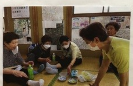
お茶のみ。これが一番!!