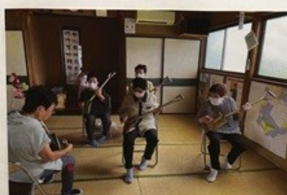
スコップ三味線もしましよ!!