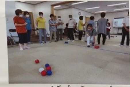
「ボッチャを楽しんでいます」