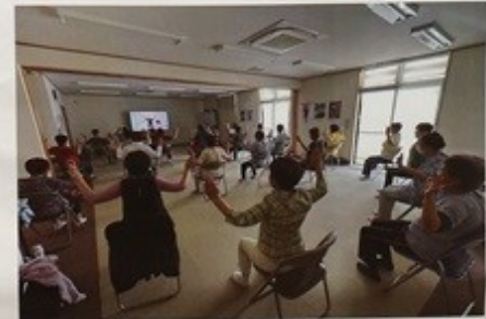
真剣に元気を見ながらがんばっています。