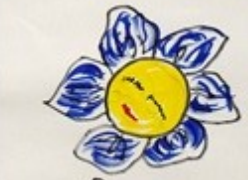
は会員がね「にこにこ岩江サロンの」バッチも作ってくれました。