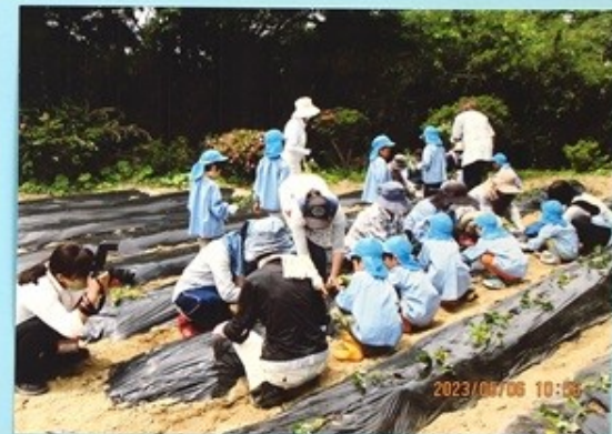
<サシマイモの植付け・フック>