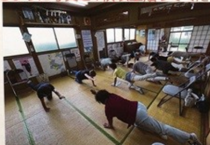
体幹トレーニングを行いました。