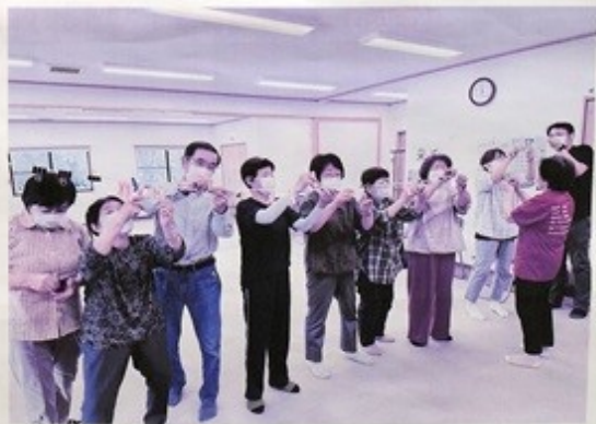
<みんなでゲーム> → 何事にも真剣な高齢者です