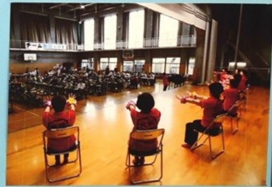
<敬老会踊り・頑張り比べ>