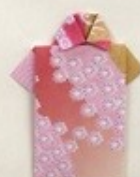
写真に写ってはい方がいるので 折紙にしてみました。