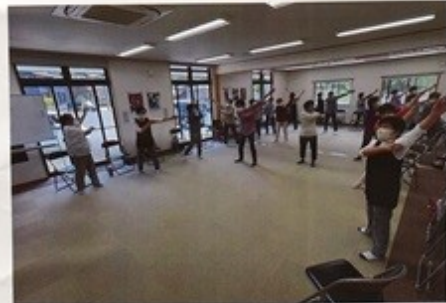
よし!! 今も肘筋はやるぞ!!