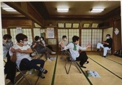
南東北のお本さんと運動

★ フリースペース ○写真を貼ったり、シールや折り紙などで自由に飾り付けてください。 活動がわかるように写真を1枚以上貼ってください。(必須)