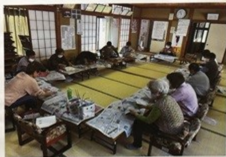
(文化祭に出す作品作り)