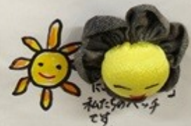
「にこにこ岩江サロンの」バッチです。